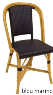
bleu marine Pantone 539