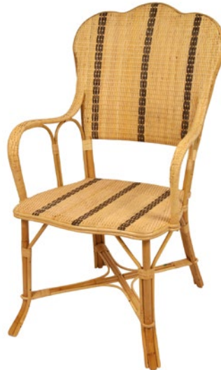
fauteuil CEZANNE • réf. 5611 L.61,5 x P.62,5 x H.102 W.24 1/4 x D.24 5/8 x H.40 3/16