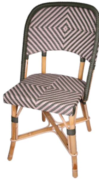
Chambord U Réf. 053904 REHVOTPSVB C05S vert olive et taupe