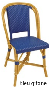
bleu gitane gypsy blue