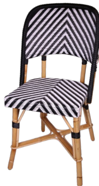
Chambord S Réf. 153904 REHNOBLSVB C15S noir et blanc