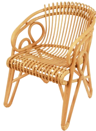
fauteuil CARDINAL • réf. 5615 L.50,5 x P.67 x H.78 W.22 x D.26 3/8 x H.34 1/4