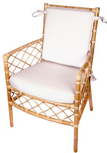
fauteuil GOFFINET • réf. 5616 L.53 x P.59 x H.96 W.21 x D.23 1/3 x H.37 2/3