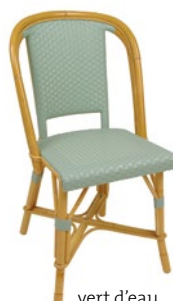
vert d'eau Pantone 5585