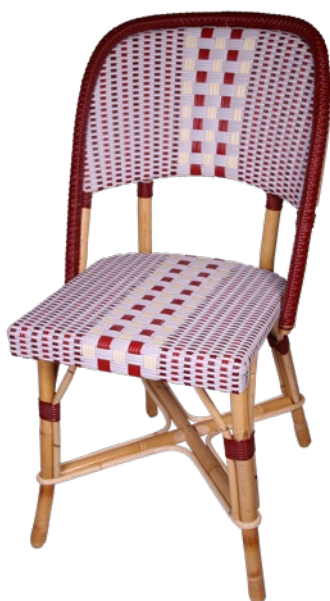
Chambord T Réf. 243904 GBRCRRSVB C24 rouge carmin, rouge rubis, et gris bleuté