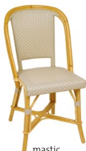
mastic Pantone 400