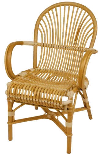
fauteuil ST JACQUES • réf. 8100V L.61 x P.71 x H.92 W.24 x D.28 x H.36 1/4