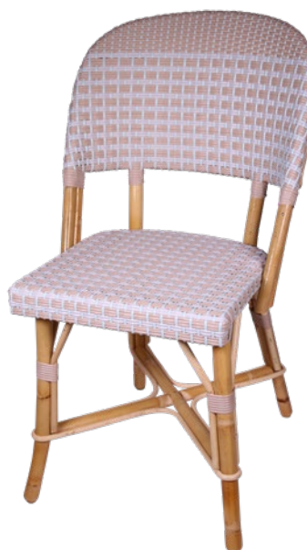
Chenonceau X Réf. 583903 REHTPGBVESVB C58 taupe, gris bleuté et vert d'eau