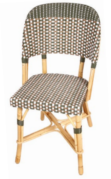
Chenonceau Q Réf. 353903 REHVOORB C35 vert olive, or et blanc