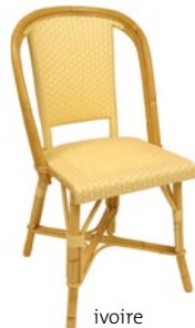
ivoire Pantone 155