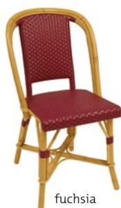
fuchsia Pantone 683