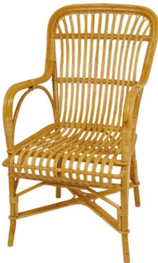
fauteuil ROUSSEAU • réf. 5609 L.57 x P.75 x H.103 W.22 1/2 x D.29 1/2 x H.40 9/16