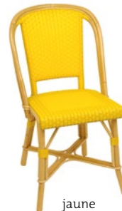
jaune Pantone 122