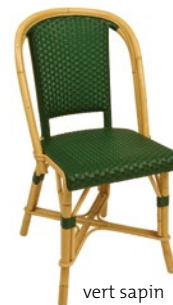
vert sapin Pantone 3485