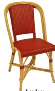
bordeaux Pantone 188