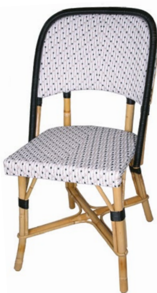
Chambord P Réf. 013904 REHBLGBTNO C01 blanc, gris, taupe et noir