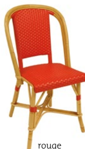
rouge Pantone 1807