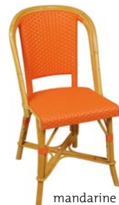
mandarine Pantone 164