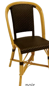
noir Pantone 426