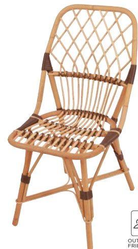
chaise MUSÉE • réf. 5450 L. 44 x P.53 x H.87,5 W.17 3/8 x D.20 7/8 x H.34 1/2