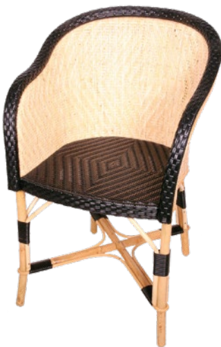
fauteuil EUGÉNIE • réf. 055613 L.60 x P.55 x H.78 W.23 1/3 x D.22 2/3 x H.34 1/4