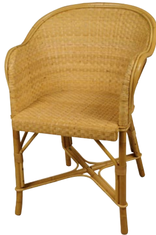
fauteuil TITANIC • réf. 5605 L.59 x P.57 x H.81 W.23 1/4 x D.22 1/2 x H.31 7/8