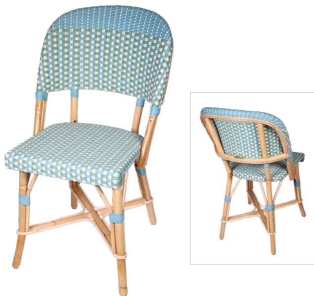
Chenonceau W Réf. 353903 REHBDVTIVSVB C35 bleu doux, vert tendre et ivoire