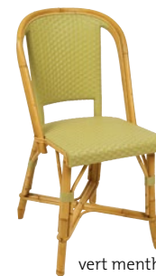
vert menthe Pantone 5787