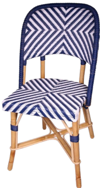
Chambord V Réf. 073904 REHBOBLSVB C07S bleu outremer et blanc