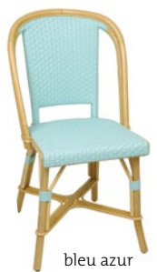
bleu azur Pantone 635