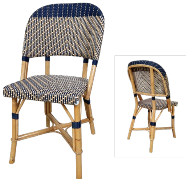
Chenonceau Y Réf. 013903 BOBEBE C01 bleu outremer, beige et blanc