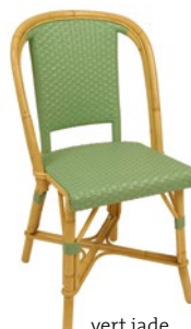
vert jade Pantone 556