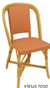
vieux rose Pantone 7522