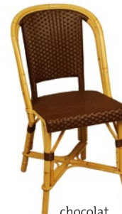
chocolat Pantone 4625